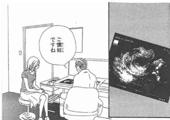
図版4 「奈々の子宮の写真」

(© Yazawa Manga Seisakusyo / Cookie SHUEISHA Inc.)