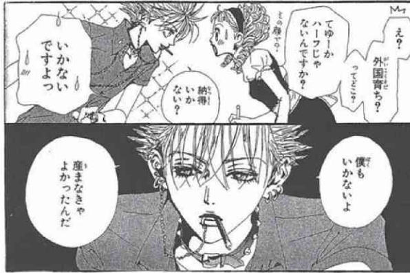
図版2 「自らの出生を嫌悪するシン」

(© Yazawa Manga Seisakusyo / Cookie SHUEISHA Inc.)