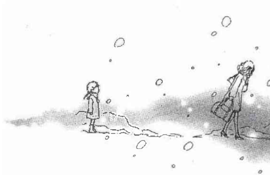
図版1 「ナナと母との別れ」

(© Yazawa Manga Seisakusyo / Cookie SHUEISHA Inc.)