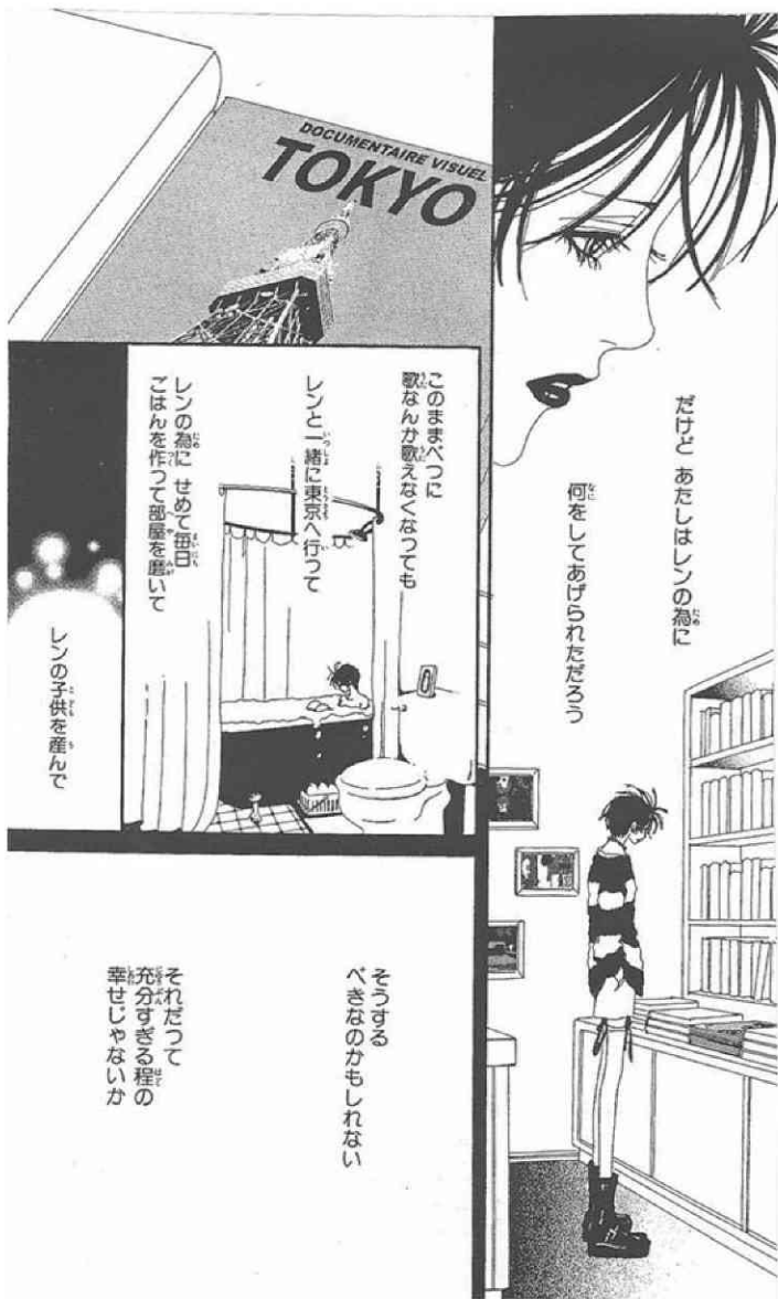
図版3 「レノの妻となることを拒むナナ」 (© Yazawa Manga Seisakusyo / Cookie SHUEISHA Inc.)