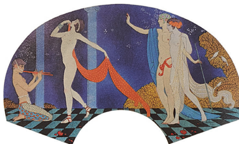
図 3 George Barbier L'Éventail et la fourrure chez Paquin

chez Paquin』を出版した。アルバムのイラストはボワレのイラストを担ったイリーブ、ルパップに加え、バルビエも参加しており、300部限定で出版された。ここでバルビエもチェッカーフロアを採り入れている(図3)。エルコリ(1992)によると、ボワレとパキャンのこれら3冊のアルバムはファッション誌の古い伝統を覆す高級ファッション誌市場に登場した「三大傑作」とされ、ポショワールは、これ以降飛躍的に発展したという。イリーブやルパップ、シャルル・マルタンと並び、バルビエは『 Journal des Dames et des Modes 』、『 Gazette du Bon Ton 』、『 Modes et Manieres d'Aujourd'hui 』など次々に出版された富裕層向け高級ファッション誌でイラストレーターとしての名を馳せた。パリでは、芸術家たちがポショワールを受け入れ、その能力を誌面で発揮したため、ポショワールという新しいことばは共通言語となり得た。